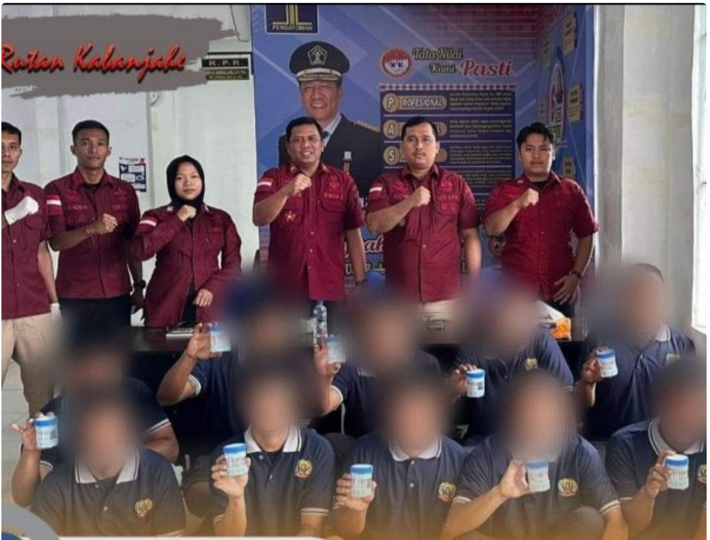
Rutan Kelas IIB Kabanjahe Test Urine Warga Binaan, Jumat (11/10-2024)

KARO - Untuk pencegahan dini akan adanya penyalahgunaan narkotika yang rentan terjadi, karena diselundupkan ditengah warga binaan.